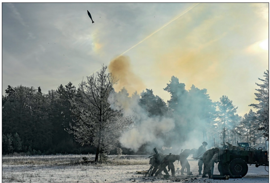
Paratroopers assigned to 1st Squadron, 91st Cavalry Regiment, 173rd Airborne Brigade, fire a 120mm mortar during a live-fire exercise at the 7th Army Training Command's Grafenwoehr Training Area, Germany, Jan. 22, 2025.