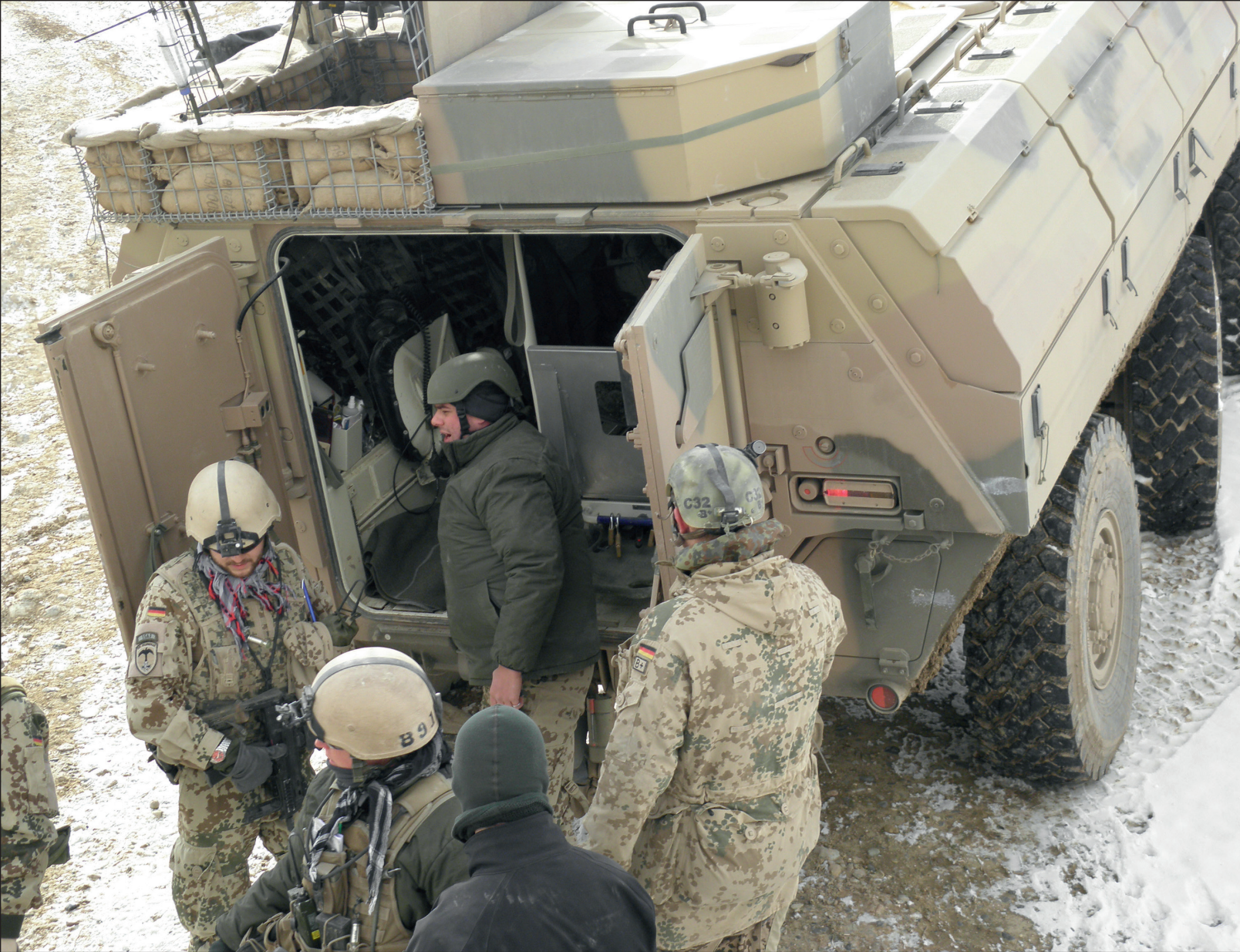
In Afghanistan wurden 125 deutsche Soldatinnen und Soldaten im Rahmen von Kampfhandlungen verwundet. Darüber hinaus verletzten sich 180 durch Sportverletzungen, Verkehrsunfälle, Dienst- und Arbeitsunfälle usw. Mehrere tausend wurden traumatisiert. Im Foto die Verbringung eines deutschen Soldaten mit einer Schussverletzung im Dezember 2011 westlich von Kunduz, Afghanistan zu sehen