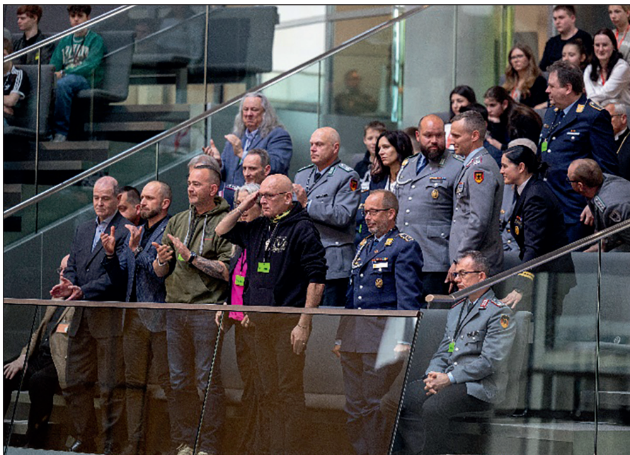
Standing Ovation: Repräsentantinnen und Repräsentanten der Veteranenbewegung am 25. April 2024 nach der Verkündung des Nationalen Veteranentages auf der Ehrentribüne des Deutschen Bundestages. Das Bild ist zum ikonischen Symbol der Bewegung geworden und steht für den Umbruch in der deutschen Veteranenpolitik. Es ist u. a. im Veteranenbüro der Bundeswehr ausgestellt.

Wo über Verwundungen debattiert wird, ist die Diskussion selten nüchtern. Auch in Veteranenkreisen stehen sich unterschiedliche Sichtweisen in Bezug auf