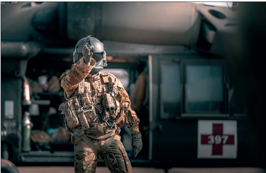
A UH-60 crew chief from Charlie Company, 1st Battalion, 214th Aviation Regiment, the MEDEVAC company of 12th Combat Aviation Brigade, signals for four litter bearers during a training exercise on Feb. 23. C Co rehearsed emergency patient movements from 'Role I' to 'Role II' treatment facilities in cooperation with the 30th Medical Brigade in the Baumholder and Ramstein area from Feb. 22-25 in preparation for Defender Europe 21.