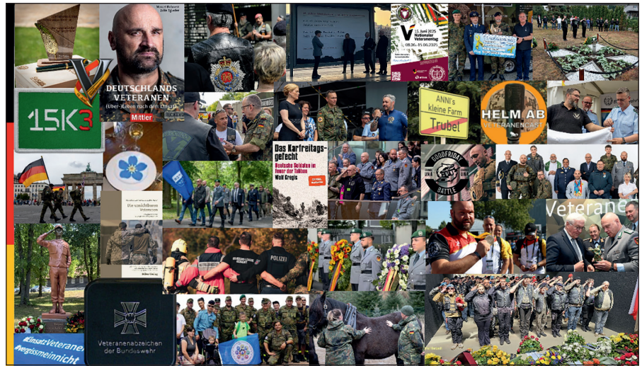
Wachsende Nationale Veteranenkultur: Es gibt in Deutschland inzwischen zahlreiche Initiativen, Vereine sowie Zusammenschlüsse und eine lebendige Veteranenbewegung.

Schon bevor Boris Pistorius als Bundesminister der Verteidigung das Wort »Kriegstüchtigkeit« erstmalig öffentlich aussprach, hatten mehrere deutsche Generale es genutzt, um ihre Forderungen mit dem entsprechenden Nachdruck zu bekräftigen. Das löste ritualisiert nicht nur gesamtgesellschaftliche Unbehaglichkeit aus – auch aus Teilen der Bundeswehr war ein befremdetes Raunen zu vernehmen. Nach Ende der intensiven Phase des Einsatzes in Afghanistan hatte das Kämpfertum wenig Konjunktur. Gefechterfahrene Einsatzrückkehrer wurden außerhalb ihrer Einheiten und Verbände als Exoten wahrgenommen. Eine ganze Generation von Einsatzveteraninnen und -veteranen fühlte sich auch deshalb an den Rand gedrängt und begann, sich zu organisieren und in Vereinen, Stiftungen und Projekten zusammenzuschließen. Durch Gedenkparaden, Motorradcoursos, Podcasts,