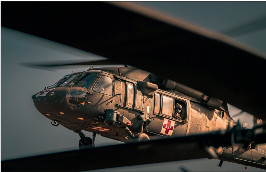
UH-60 crews from Charlie Company, 1st Battalion, 214th Aviation Regiment, the MEDEVAC company of 12th Combat Aviation Brigade, rehearsed emergency patient movements from 'Role I' to 'Role II' treatment facilities in cooperation with the 30th Medical Brigade in the Baumholder and Ramstein area from Feb. 22-25 in preparation for Defender Europe 21.