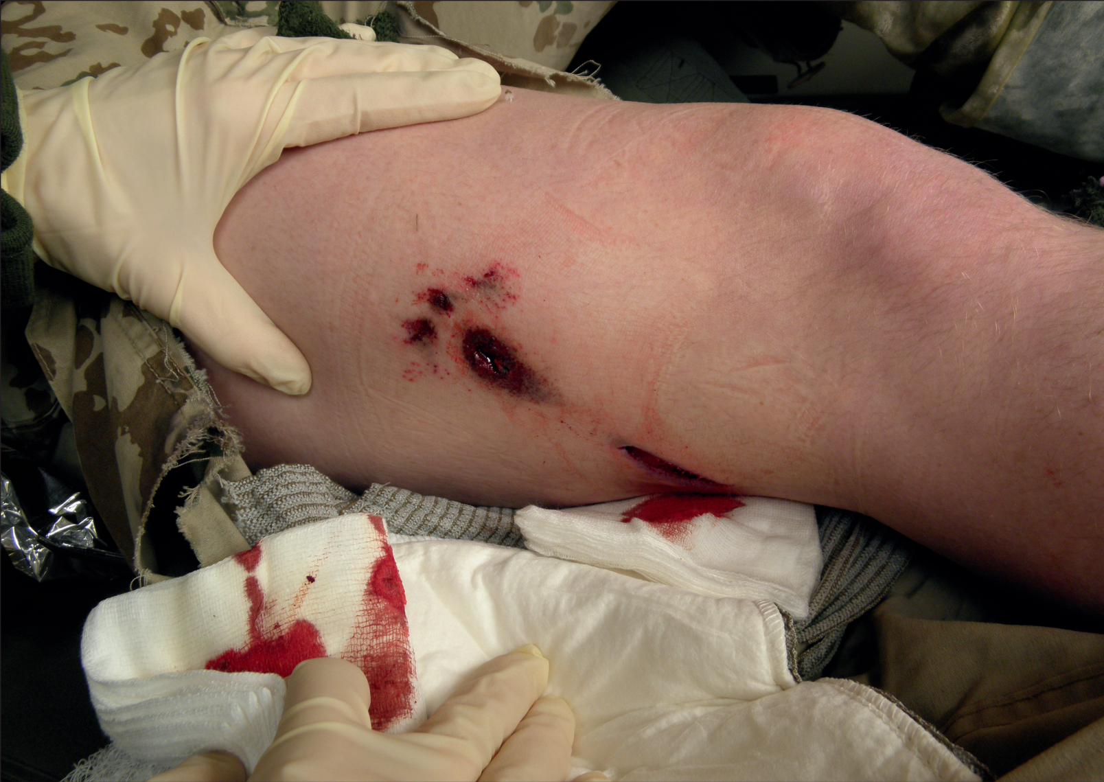
Verwundung ist für die betroffenen Soldatinnen und Soldaten zweifelsohne eine Zäsur. Auch wenn über zwei Drittel der Befragten in der Pilotstichprobe zum Verwundetenabzeichen eine Einführung klar begrüßt, birgt sie auch Schwächen und Risiken, die es in der Debatte zu berücksichtigen gilt.

der historischen Dokumentation militärischer Einsatzerfahrungen dienen. Die Einführung eines entsprechenden Abzeichens könnte daher auch als Schritt zur strukturellen Ergänzung des bestehenden deutschen Auszeichnungssystems interpretiert werden.